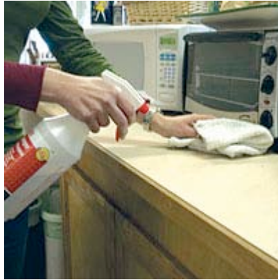
Es preferible usar productos de limpieza que no sean dañinos a la salud.

Regrese a lo práctico. Limpiar su casa con bicarbonato y vinagre, por ejemplo, podrían parecerle austero, poco práctico y quizá ridículo, pero son funcionales. Sobre todo si con su uso, no le causan ningún daño.